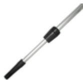
Teleskopstiel Alu ausziehbar